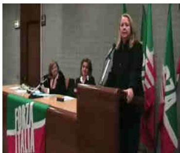
L'Onorevole Isabella Bertolini interviene al Congresso comunale di Modena