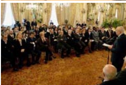
L'On. Bertolini partecipa alla cerimonia al Quirinale

L'Onorevole Isabella Bertolini di Forza Italia, Vice Presidente del Comitato Parlamentare di controllo sull'attuazione dell'accordo di Schengen, di vigilanza sull'attività di Europol, di controllo e vigilanza in materia di immigrazione , ha partecipato lunedì 12 febbraio, su invito del Presidente della Repubblica Giorgio Napolitano, alla cerimonia organizzata al Quirinale per il conferimento delle nuove cittadinanze italiane da parte del Capo dello Stato.