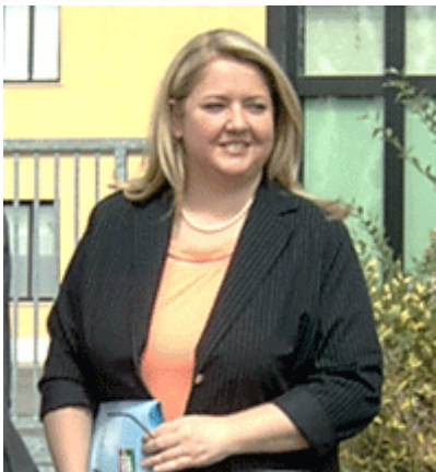
L'On. Isabella Bertolini durante una recente visita al CPT di Modena

"Siamo assolutamente insoddisfatti della non-risposte data dal Ministero dell'Interno alle domande che abbiamo formulato in una interrogazione urgente in commissione sulle gravi minacce che hanno spinto i responsabili della Misericordia di Modena e Bologna a rinunciare alla gestione dei Centri di permanenza temporanea in Emilia Romagna. Ora abbiamo la conferma che il governo Prodi non solo non è in grado di dare risposte sull'organizzazione dei CPT ma ciò che è più preoccupante non ha né la capacità né la volontà di garantire la sicurezza degli operatori".