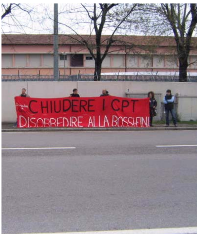
Manifestanti no-global davanti al CPT di Bologna

Per questo la risposta data dal governo è insufficiente ed offensiva e in quanto tale ci spinge a continuare con grande determinazione la nostra battaglia per difendere la legge Bossi Fini, per salvaguardare la funzione dei CPT e per rimandare a casa un governo che ha dimostrato di non volere il bene dell'Italia".