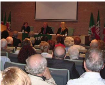
La sala gremita in occasione dell'appuntamento modenese, sabato 30 settembre 2006, con il Senatore Paolo Guzzanti

Grande successo di pubblico, venerdì 29 settembre e sabato 30 settembre, ai due appuntamenti organizzati rispettivamente Budrio (Bologna) e a Modena da Forza Italia, con il Senatore Paolo Guzzanti , già Presidente della Commissione di inchiesta sul dossier Mitrokhin.