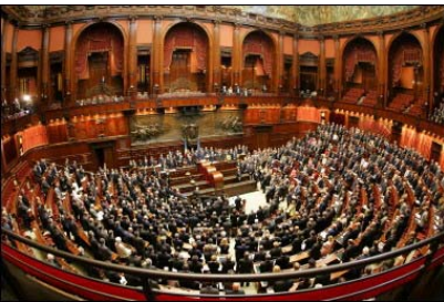
La manovra finanziaria per il 2007, approvata dal Consiglio dei Ministri, dovrà ora affrontare la discussione parlamentare