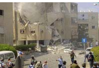
La città israeliana di Haifa bombardata