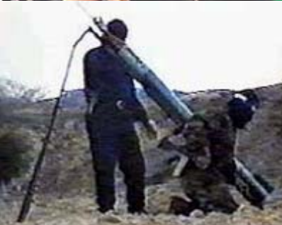
Posizione Hezbollah di missili Kassam

La mozione si conclude con l'auspicio di un accordo di pace e di civile convivenza che veda destituite di ogni possibilità di azione le organizzazioni terroristiche che operano in Libano e a Gaza.