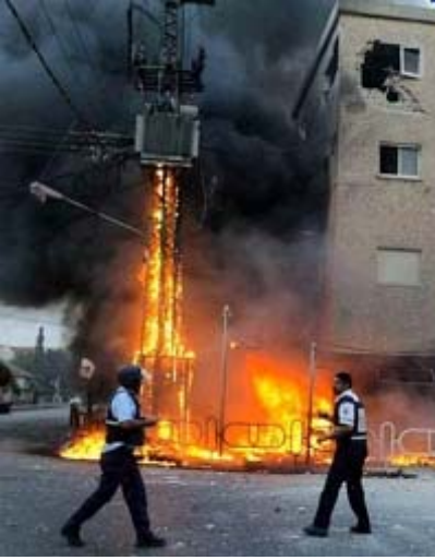
La città Israeliana di Haifa colpita dai razzi degli Hezbollah dal Libano

verno israeliano, e avverto la necessità di mobilitare l'opinione pubblica italiana e internazionale, europea in particolare, in difesa d'Israele. L'attacco al popolo e allo Stato democratico d'Israele è parte dell'offensiva che il terrorismo ha scatenato contro il mondo libero".