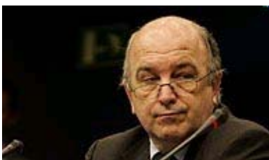
Nella foto in basso J. Almunia

"A smentire l'allarmismo di Prodi e compagni sui conti pubblici sono bastate le parole del portavoce del commissario europeo Joaquín Almunia che, rispondendo alla domanda di un giornalista, ha auspicato che il Governo italiano applichi rigorosamente la Finanziaria varata dal Governo Berlusconi e ne adotti una per 2007 che segua lo stesso percorso di consolidamento".