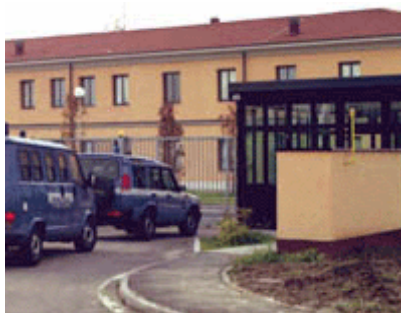
Nella foto in basso il CPT di Modena

Il Governo Berlusconi era dalla parte dei cittadini. L'esecutivo Prodi solo da quella dei clandestini. Siamo di fronte a un delirio che offende la nostra storia, la nostra cultura, la nostra Costituzione."